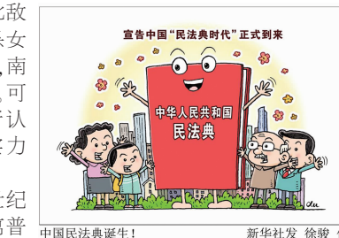
中国民法典诞生! 1

已,不升官。”杀北敌所获赏赐最多,杀女子所获赏赐最低,南蛮处于二者之中。可见当时的统治者认为北方蛮夷的实力是强于南方的。 现处于21世纪文明社会,战乱离普通人已经非常遥远,自然法律也不会规定上阵杀敌论功行赏的等级问题。但法律支持普通人也可以为国家揪出“蛀虫”,根据“蛀虫”的危害大小而“论功行赏”。群众举报就是监察机关查处职务犯罪工作的重要来源。随着法治进程的深入推进和反腐力度的加大,调动和保护人民群众举报的积极性就显得十分重要。根据案件的危害性,举报奖励金额也有不同的层级划分。从这一角度来说,现代法律按举报线索重要性分层级奖励金额的规定和明朝法律按杀敌地区划分功勋等级的立法精神是一致的。 《贞观政要·公平》中说,法,国之权衡也,时之准绳也。中华上下五千年,法的精神一直贯穿其中。或许有些古时的法律条文在如今看来已经和社会脱轨,没有借鉴意义,但其中的法治精神却可以让我们不断汲取,不断完善现代法律。古知而鉴今,只有不忘历史,站在前人的肩膀上,才能得到更好的发展,建设社会主义法治国家。 (法务部 王巾帼)